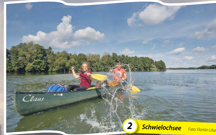
2 Schwielochsee