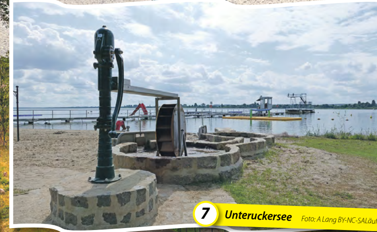
7 Unteruckersee