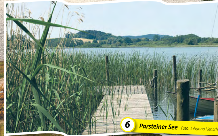
6 Parsteiner See