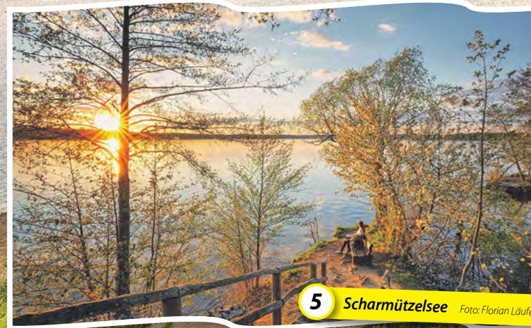
5 Scharmützelsee