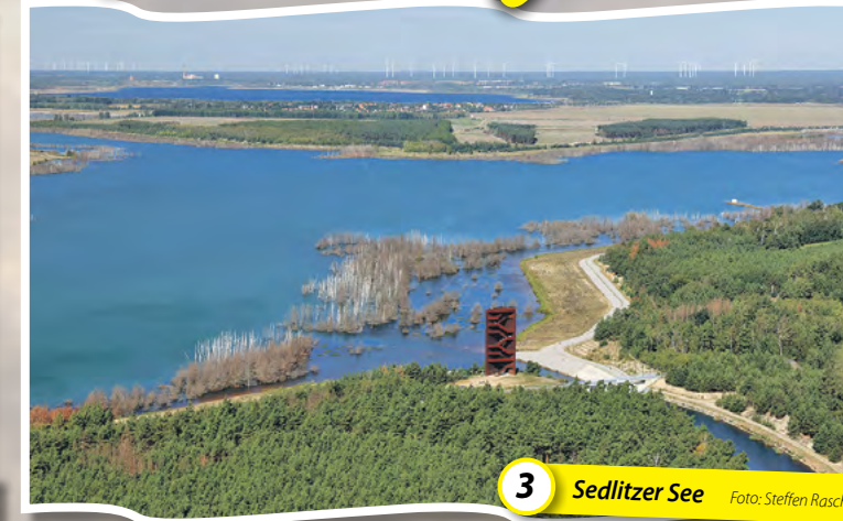
3 Sedlitzer See