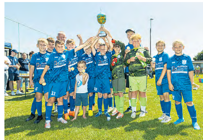
Die Begeisterung ist den Spielern anzusehen: Der FC Deetz freut sich über den wohlverdienten Turniersieg.