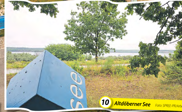
10 Altdöbener See

Weite Reisen sind nicht so Ihr Ding? Es zieht Sie eher in die heimische Natur – und am liebsten auf Schusters Rappen? Dann hätten wir da was für Sie: die Iron Lake Challenge*. Wir geben zu, dass bei einem Kaltstart in das 10-Seen-Wanderabenteuer