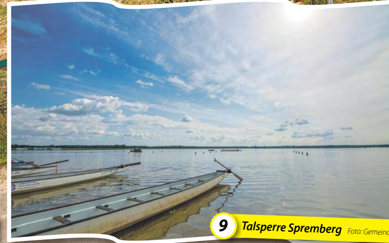
9 Talsperre Spremberg