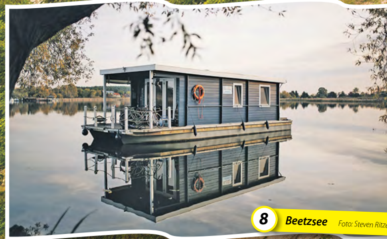
8 Beetzsee