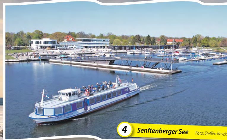
4 Senftenberger See