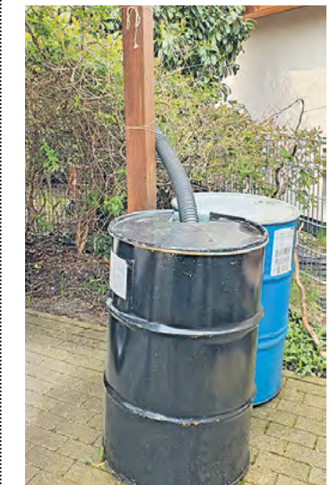
Angesichts zunehmender Trockenheit ist aufgefangenes Regenwasser sehr wertvoll. In die Kanalisation darf das kostbare Gut aber nicht weitergeleitet werden.

Zu Beginn des Jahres 2024 war eine erhöhte Niederschlagsintensität festzustellen, in dessen Folge es u. a. zu erhöhten Grundwasserständen, Flutungen von Kellerräumen und Unterspülungen von Baulichkeiten gekommen ist. Bei den Bewohnern führte die Ableitung dieser Wässer teilweise zu erheblichen Problemen, sofern auf den Grundstücken keine ausreichenden Kapazitäten für eine Speicherung der Wasser, eine funktionierende Versickerungseinrichtung oder eine Ableitung in die öffentlichen Regenwasserkanäle gegeben war.