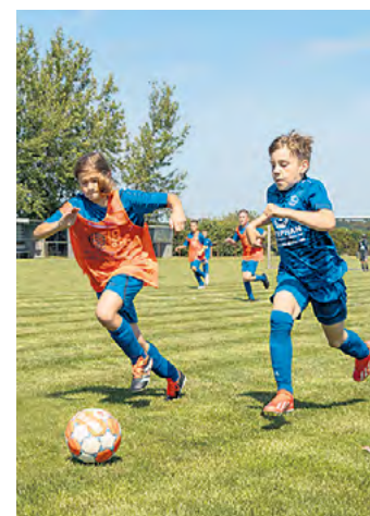
Die Nachwuchskicker*innen aus der Region zeigten, was sie draufhaben.

ler aus Ländern wie Deutschland, Spanien, Italien, England, Frankreich oder Portugal an; und die auflaufenden Spieler hießen auch nicht Toni Kroos, Joselu, Gianluigi Donnarumma, Harry Kane, Kylian Mbappé oder Cristiano Ronaldo – dennoch garantierte der diesjährige Kampf um den Wasserpokal wieder spannende Partien und ausgelassene Stimmung bei den Zuschauerinnen und Zuschauern.