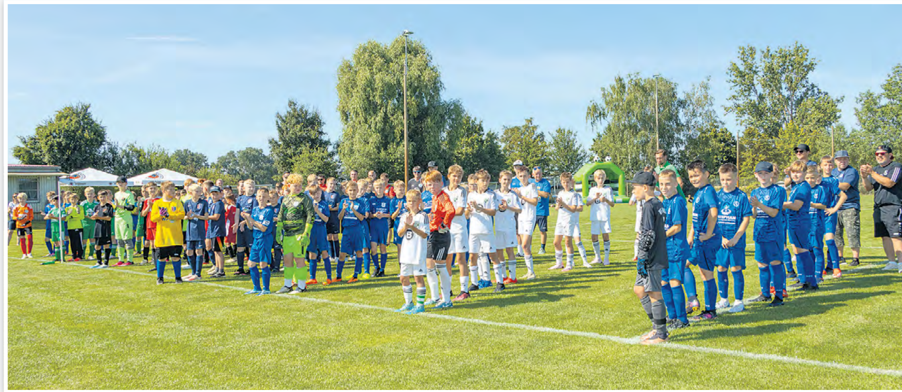
Eine gelungene Abwechslung zur laufenden Europameisterschaft: das 11. Havelländische Wasserpokalturnier auf dem Sportplatz des FSV 1950 Wachow/Tremmen e.V.

Dort fand nämlich am 29. Juni ab 10 Uhr das Havelländische Wasserpokalturnier statt, das bereits zum 11. Mal im Verbandsgebiet des WAH ausgetragen wurde. Zwar traten hier nicht die besten Auswahlspie-